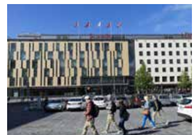
Scandic Tampere City **** (Nordic Swan Ecolabel)