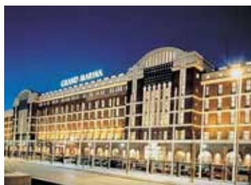
Scandic Grand Marina **** (Nordic Swan Ecolabel)

Oder Scandic Tampere City, im Herzen von Tampere, gleich gegenüber dem Bahnhof und in der Nähe der besten Einkaufsstraßen und Sehenswürdigkeiten. Stilvolle Zimmer, Restaurant und Eco Label garantieren einen erholsamen und nachhaltigen Aufenthalt.